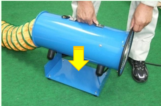
① 換気扇を補助スタンドの上に乗せます。