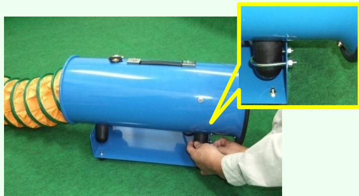
② 換気扇のゴム脚は、Uボルトと平ワッシャ、ナットを使用し、補助スタンドに固定します。