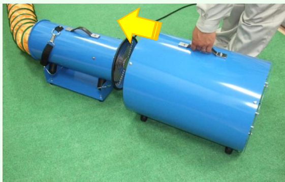
③ 換気扇吸入口に防音筒をはめ込みます。