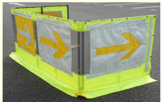
交通誘導員防護柵として